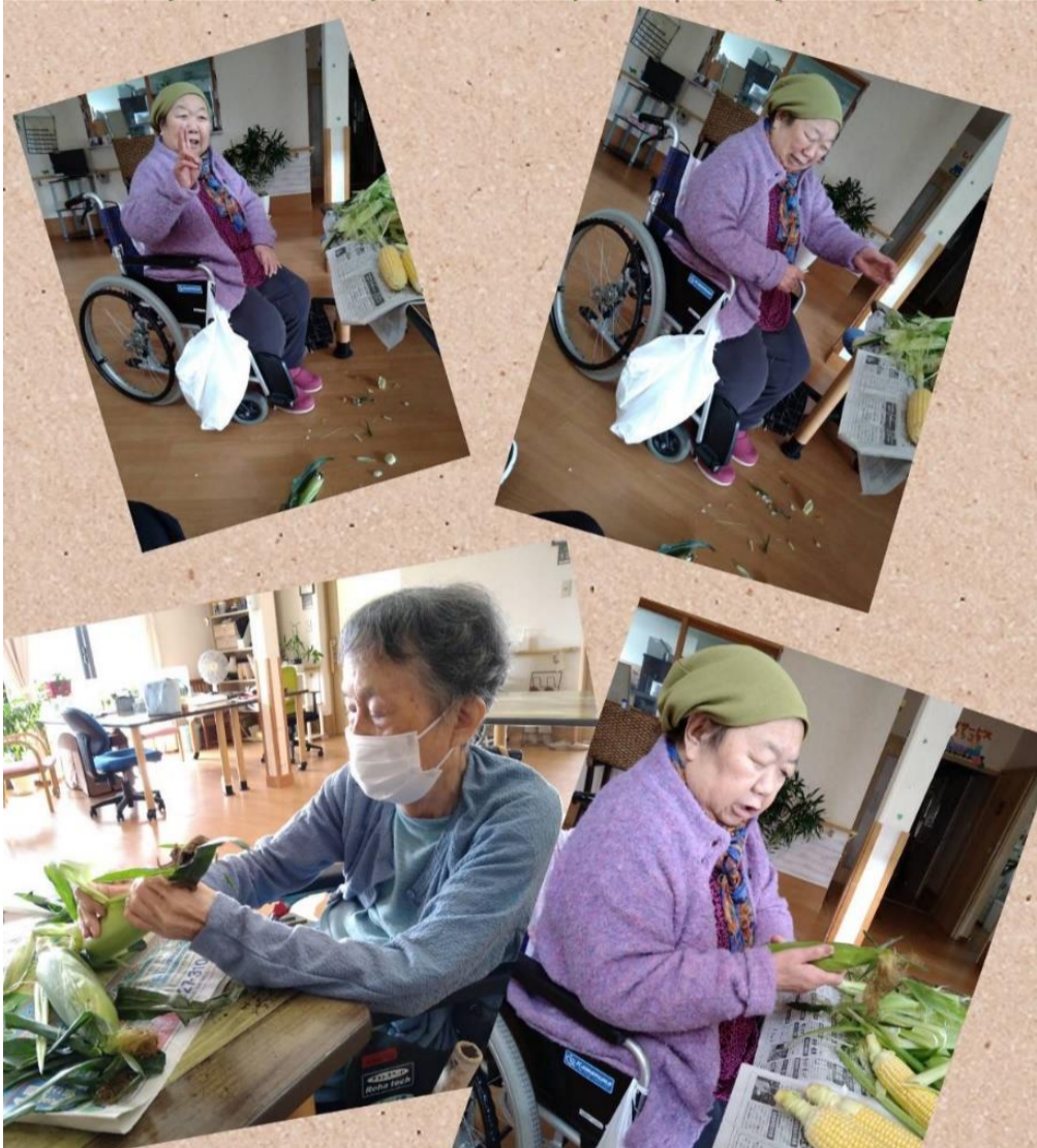
とうもろこしの皮むきのお手伝い